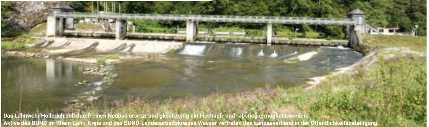
Das Lahnwehr Hollerich soll durch einen Neubau ersetzt und gleichzeitig ein Fischauf- und -abstieg ermöglicht werden. Aktive des BUND im Rhein-Lahn-Kreis und des BUND-Landesarbeitskreises Wasser vertreten den Landesverband in der Öffentlichkeitsbeteiligung.

Globaler, nationaler und regionaler Problemfall: