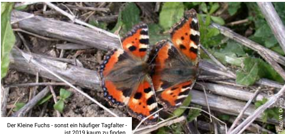
Der Kleine Fuchs - sonst ein häufiger Tagfalter - ist 2019 kaum zu finden.

Bereits 2007 hat die Bundesregierung eine „Nationale Strategie zur Biologischen Vielfalt“ verabschiedet. 2015 beschloss auch die rheinland-pfälzische Landesregierung