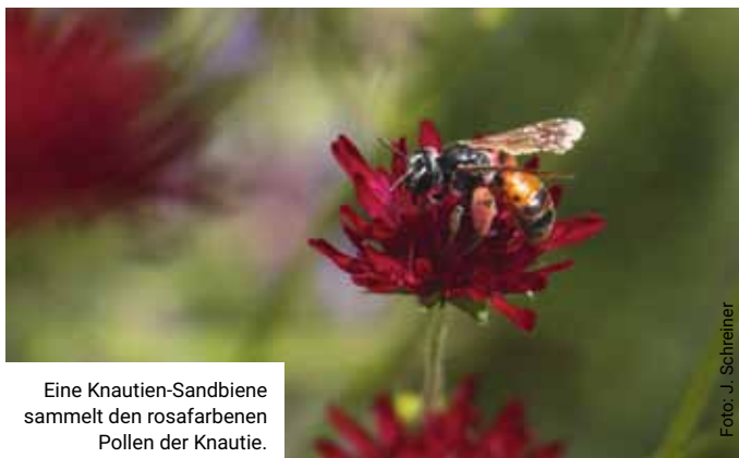
Eine Knautien-Sandbiene sammelt den rosafarbenen Pollen der Knautie.