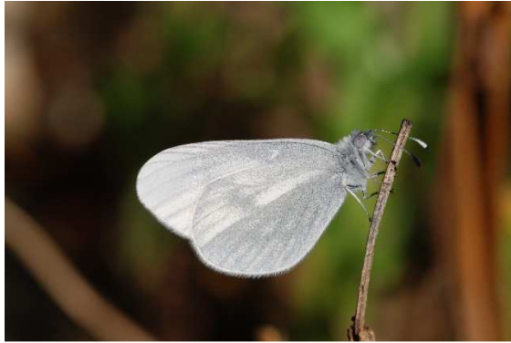
Abbildung 3: Weibchen des Leguminosens-Weißlings am 19.4.2009 in Bingen (Zuchtfoto – ex ovo)