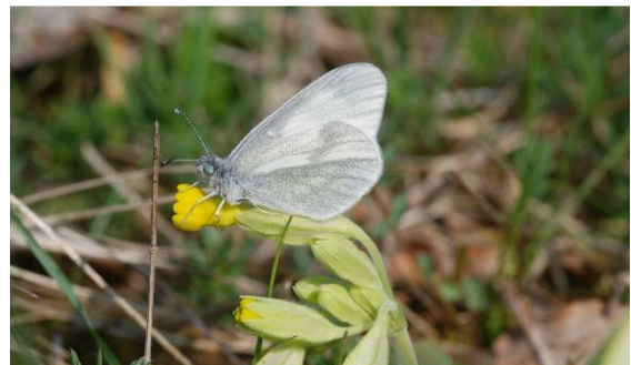
Abbildung 22: Leguminosens-Weißling bei Bewölkung setzen sich die Tiere wie hier schnell auf eine erhöhte Pflanze (Primel) ab. Binger Wald am 14.4.2009