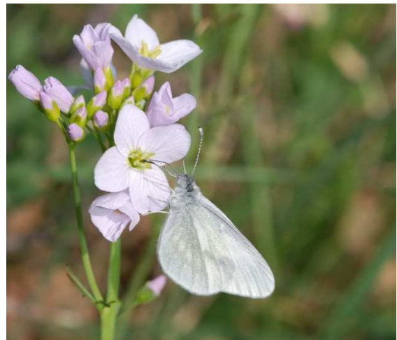
Abbildung 6: Leguminosens-Weißling bei der Nektaraufnahme an Wiesenschaumkraut im Binger Wald bei Dichtelbach am 14.4.2009

Die späteste Beobachtung eines Weibchens erfolgte am 9.8.2017 auf dem Rheindamm bei Ingelheim bei einer Eiablage, die späteste Beobachtung eines Männchens am 25.8.2017 auf einer Waldwiese bei Stein-Bockenheim. Die Falter setzen sich bei Bewölkung einfach auf erhöhte Pflanzen in der Vegetation. Sie saugen an Blüten unterschiedlicher Farben, wie z.B. Wiesenschaumkraut, Primeln, Bocksbart und sehr gerne an Vogelwicken und Platterbsen.