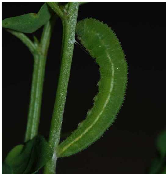
Abbildung 14: Vorpuppe des Leguminosen-Weißlings am 22.8.2008 an Hornklee (Zuchtfoto - ex ovo)

Zur Verpuppung sucht sich die Raupe einen geschützten Platz z.B. an der Fraßpflanze und spinnt sich mit dem Fußende unten an. Im Brustbereich spinnt sie einen Gürtel aus einer Vielzahl von Spinnfäden an die Unterlage. Zuletzt begibt sie sich in den Gürtel und es beginnt die Ruhephase der Vorpuppe.