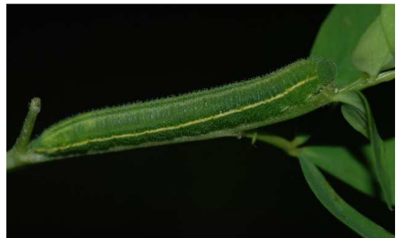
Abbildung 13: Erwachsene Raupe des Leguminosen-Weißlings auf Hornklee am 19.8.2008 in Bingen-Dromersheim (Zuchtfoto - ex ovo)

Schon bald nimmt die Raupe ihre grüne Farbe mit dunkelgrüner Rückenlinie und weiß-gelben Seitenlinien an.