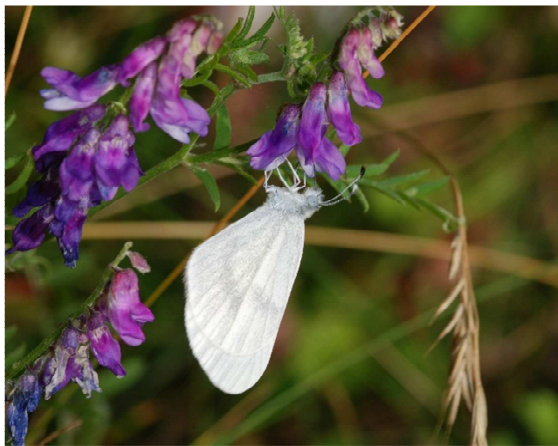
Abbildung 24: Leguminosen-Weißling saugend an Vogelwicke im Binger Wald nahe dem Jägerhaus am 22.7.2009

Der Leguminosen-Weißling leidet unter dem starken Eintrag von Stickstoff, insbesondere durch die Landwirtschaft, in die Flächen. Im Garten wird man die Art selten antreffen. Jede Vermeidung von Stickstoffeintrag und eine Vermeidung von zu kurzen Mähfrequenzen, sowie zu frühen und koinzidenten Mähzeitpunkten hilft der Art. Dies gilt insbesondere für die Pflege von Bahndämmen und Deichen: kein Einsatz von Chemie (Glyphosat etc.), Mahd nur einmal im Jahr, Abtransport des Mähgutes (kein Mulchen!), Mähzeitpunkt ab Mitte Juli und immer nur Mosaikmahd, also höchstens 100 m am Stück, die nächsten 100 m sechs Wochen später usw.