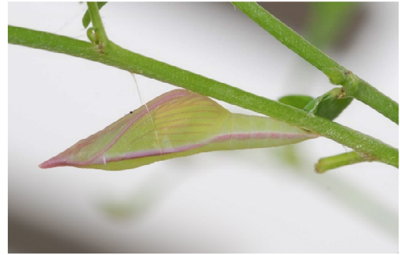
Abbildung 16: Puppe des Leguminosen-Weißlings am 29.8.2008 an Hornklee (Zuchtfoto - ex ovo)

Die schöne Gürtelpuppe wird in den nächsten Tagen noch verblässen und nimmt dann ihre sehr schöne grünlichrote Farbe an.