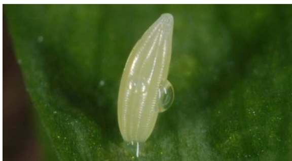
Abbildung 10: Vergrößerung des frisch abgelegten Eies des Leguminosen-Weißlings des obigen Bildes

Die Eier sind länglich, laufen konisch zusammen, sind aber oft leicht gebogen.