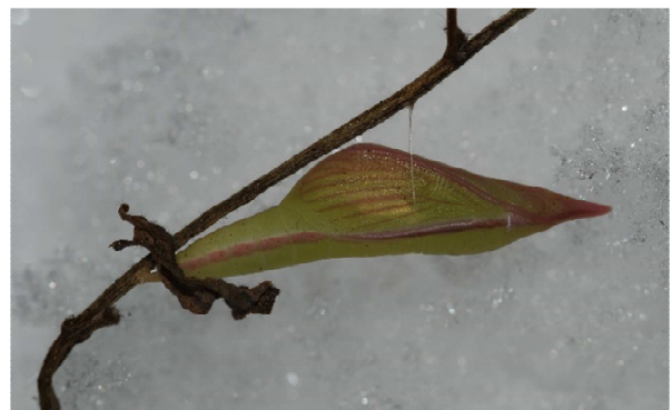
Abbildung 18: Überwinternde Puppe des Leguminosen-Weißlings im Schnee am 6.1.2009 (Zuchtfoto - ex ovo)

Der Leguminosen-Weißling überwintert als Puppe im Freien.