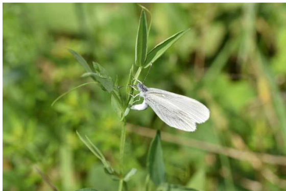
Abbildung 8: Eiablage des Leguminosen-Weißlings auf dem Rheindamm bei Ingelheim auf Vogelwicke am 9.8.2017

Im Frühjahr beginnt die Eiablage Ende April. Beobachtet wurde die Eiablage an sonnig stehender Vogelwicke auf einer Magerwiese im Binger Wald und auf dem Rheindamm bei Ingelheim. Nach Literaturangaben kommen auch andere Leguminosen wie Hornklee oder Platterbsen als Eiablagepflanzen in Betracht. Die Eier werden einzeln auf die schmalen Blätter abgelegt.