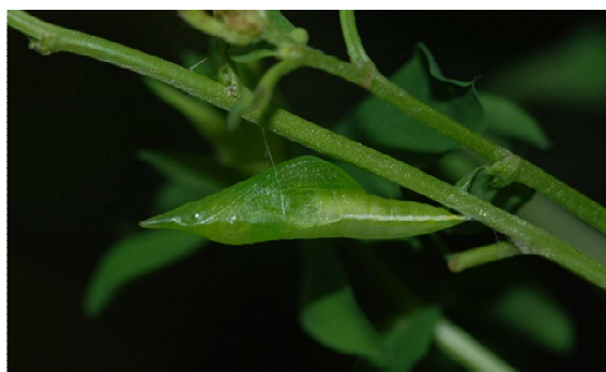
Abbildung 15: Frische Puppe des Leguminosen-Weißlings am 24.8.2008 an Hornklee (Zuchtfoto - ex ovo)

Hormonell gesteuert löst sich langsam die letzte Raupenhaut und platzt auf. Durch Zuckungen und Drehungen wird die Raupenhaut abgestreift und die Puppenhaut erscheint.