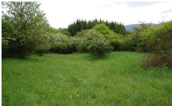
Abbildung 4: Gebüschaum im Binger Wald mit angrenzender Wiese am 19.5.2012- hier fliegt ab Mitte April jährlich der Leguminosens-Weißling

Der Leguminosens-Weißling bevorzugt magere Saumstandorte. Er lebt auf mageren Wiesen, aber auch an Deichen, auf Dämmen, auf Waldwiesen, aber auch auf nährstoffarmen Grünland mit Hornklee und Wicken.