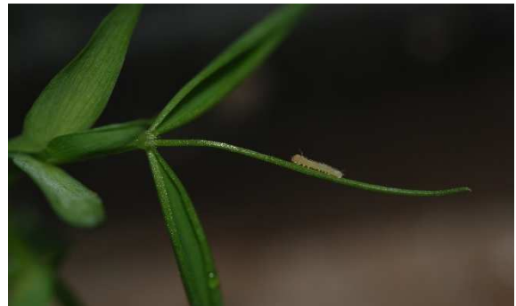
Abbildung 11: Frisch geschlüpfte Raupe des Leguminosen-Weißlings am 28.7.2008 auf Vogelwicke in Bingen-Dromersheim (Zuchtfoto ex ovo)

Die frisch geschlüpfte Raupe ist zunächst hell-transparent mit feinen langen Haaren bedeckt.