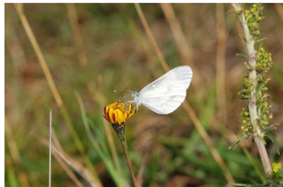
Abbildung 7: Leguminosens-Weißling beim Saugen an Bocksbart am 15.7.2008 im Binger Wald

Neben Blüten saugen die Falter auch gerne an feuchter Erde.