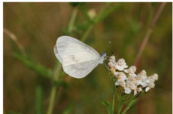
Abbildung 2: Männchen des Leguminosen-Weißlings im Binger Wald bei Dichtelbach am 31.7.2008 auf Schafgarbe – das grau der Spitzen der Vorderflügeloberseiten ist erkennbar.

Die selten zu sehende Flügeloberseite ist beim Weibchen einheitlich weiß, beim Männchen sind die äußeren Spitzen der Vorderflügel grau.