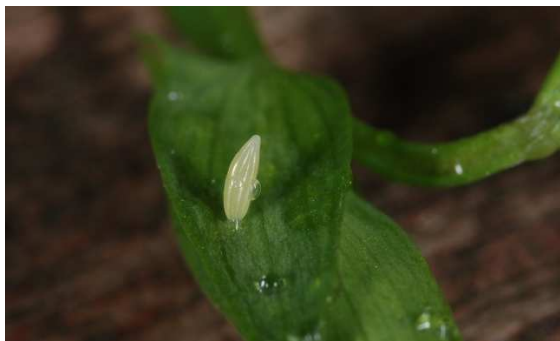
Abbildung 9: Frisch abgelegtes Ei des Leguminosen-Weißlings auf Vogelwicke am 23.7.2008 im Binger Wald bei Dichtelbach

Die Eier sind länglich, laufen konisch zusammen, sind aber oft leicht gebogen.