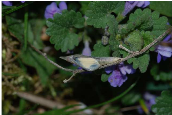
Abbildung 19: Puppe des Leguminosens-Weißlings nach der Überwinterung am 16.4.2009 (Zuchtfoto - ex ovo)

dünne Puppenhaut die Flügelfarbe der Falter erkennbar.