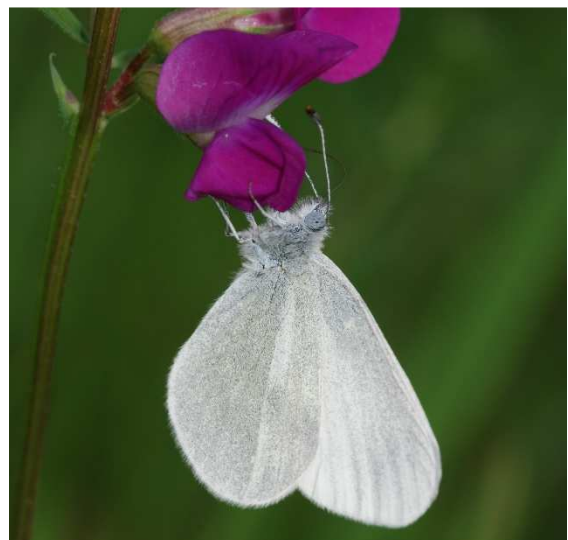
Abbildung 23: Leguminosens-Weißling saugend an Platterbse am 16.5.2008 im Binger Wald bei Dichtelbach

Der Leguminosens-Weißling ist für die Zucht in Umweltbildungsprojekten weniger geeignet. Die Eier oder Raupen der ersten Generation sind schwierig zu finden. Die Raupen der zweiten Generation entwickeln erst im nächsten Jahr zum Falter.