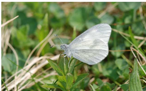
Abbildung 5: Leguminosens-Weißling auf einer Magerwiese im Binger Wald bei Dichtelbach am 13.4.2009

Die jahreszeitlich früheste Beobachtung gelang am 9.4.2009 in Bad Sobernheim und am 13.4.2009 im Binger Wald auf einer Magerwiese.