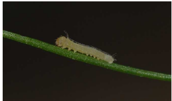
Abbildung 12: Vergrößerung des obigen Fotos der frisch geschlüpften Raupe des Leguminosen-Weißlings

Schon bald nimmt die Raupe ihre grüne Farbe mit dunkelgrüner Rückenlinie und weiß-gelben Seitenlinien an.