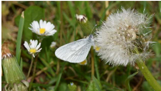
Abbildung 20: Frühjahrsfalter des Leguminosens-Weißlings an einer Pusteblume am 27.4.2014 im Freilichtmuseum in Bad Sobernheim, direkt neben dem Schmetterlingspfad.

Schon kurze Zeit später ist der Falter geschlüpft.