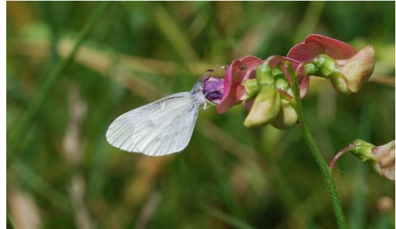
Abbildung 21: Sommerfalter des Leguminosens-Weißlings an Platterbse am 16.7.2008 im Oberolmer Wald bei Mainz-Lerchenberg

Die Falter der zweiten Generation sind etwas zahlreicher als die Frühjahrsgeneration und deshalb im Juli bis Mitte August recht einfach auf den Rheindeichen in Rheinhessen oder im Binger Wald oder im Oberolmer Wald in schöner Regelmäßigkeit zu beobachten.