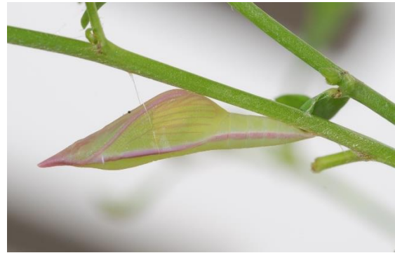
Abbildung 16: Puppe des Leguminosen-Weißlings am 29.8.2008 an Hornklee (Zuchtfoto - ex ovo)

Die schöne Gürtelpuppe wird in den nächsten Tagen noch verblassen und nimmt dann ihre sehr schöne grünlichrote Farbe an.