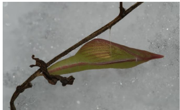
Abbildung 18: Überwinternde Puppe des Leguminosen-Weißlings im Schnee am 6.1.2009 (Zuchtfoto - ex ovo)

Der Leguminosen-Weißling überwintert als Puppe im Freien.