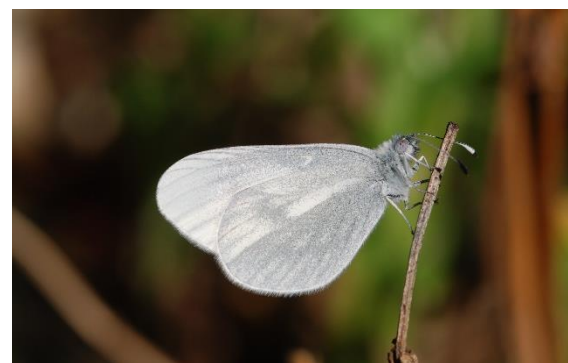
Abbildung 3: Weibchen des Leguminosen-Weißlings am 19.4.2009 in Bingen (Zuchtfoto – ex ovo)