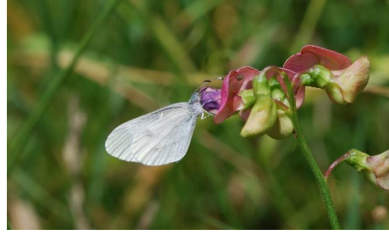
Abbildung 21: Sommerfalter des Leguminosens-Weißlings an Platterbse am 16.7.2008 im Oberolmer Wald bei Mainz-Lerchenberg

Die Falter der zweiten Generation sind etwas zahlreicher als die Frühjahrsgeneration und deshalb im Juli bis Mitte August recht einfach auf den Rheindeichen in Rheinhessen oder im Binger Wald oder im Oberolmer Wald in schöner Regelmäßigkeit zu beobachten.