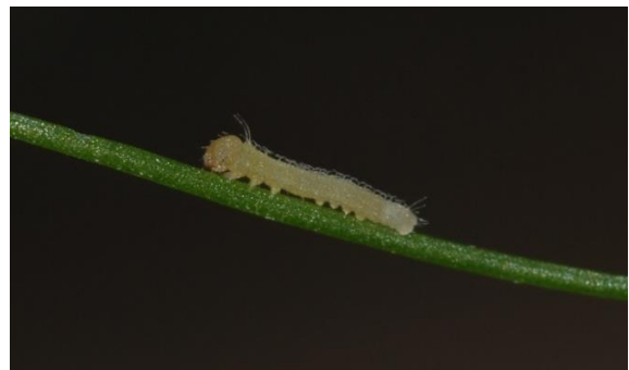
Abbildung 12: Vergrößerung des obigen Fotos der frisch geschlüpften Raupe des Leguminosen-Weißlings

Schon bald nimmt die Raupe ihre grüne Farbe mit dunkelgrüner Rückenlinie und weiß-gelben Seitenlinien an.