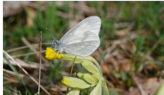
Abbildung 22: Leguminosens-Weißling bei Bewölkung setzen sich die Tiere wie hier schnell auf eine erhöhte Pflanze (Primel) ab. Binger Wald am 14.4.2009