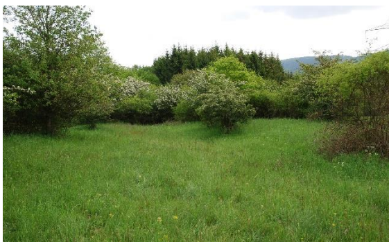
Abbildung 4: Gebüschaum im Binger Wald mit angrenzender Wiese am 19.5.2012- hier fliegt ab Mitte April jährlich der Leguminosen-Weißling

Der Leguminosen-Weißling bevorzugt magere Standorte. Er lebt auf mageren Wiesen, aber auch an Deichen, auf Dämmen, auf Waldwiesen, an Gebüschsäumen, aber auch auf nährstoffarmen Grünland mit Hornklee und Wicken.