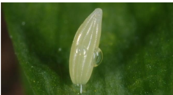
Abbildung 10: Vergrößerung des frisch abgelegten Eies des Leguminosen-Weißlings des obigen Bildes

Die Eier sind länglich, laufen konisch zusammen, sind aber oft leicht gebogen.