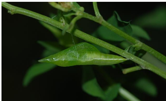
Abbildung 15: Frische Puppe des Leguminosen-Weißlings am 24.8.2008 an Hornklee (Zuchtfoto - ex ovo)

Hormonell gesteuert löst sich langsam die letzte Raupenhaut und platzt auf. Durch Zuckungen und Drehungen wird die Raupenhaut abgestreift und die Puppenhaut erscheint.