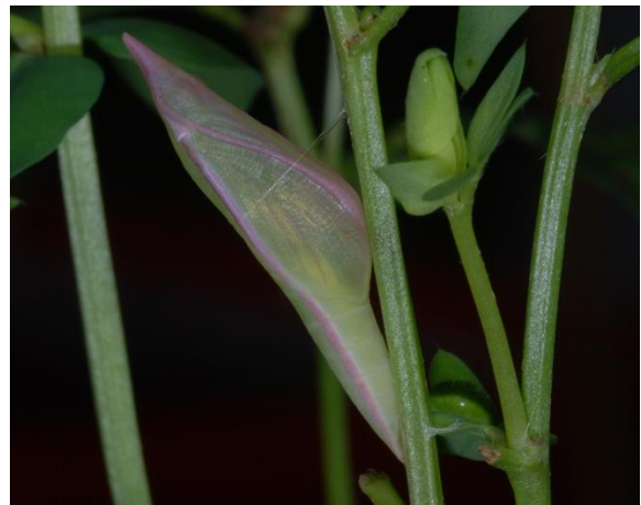
Abbildung 17: Puppe des Leguminosen-Weißlings am 5.9.2008 an Hornklee (Zuchtfoto - ex ovo)

Die Herbstpuppe geht jetzt in eine Diapause und wird erst im nächsten Frühjahr schlüpfen.