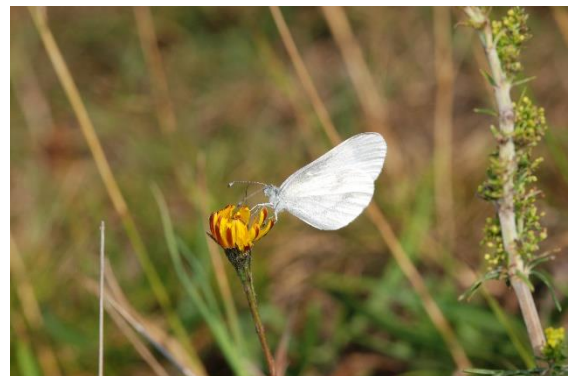
Abbildung 7: Leguminosen-Weißling beim Saugen an Bocksbart am 15.7.2008 im Binger Wald

Neben Blüten saugen die Falter auch gerne an feuchter Erde.