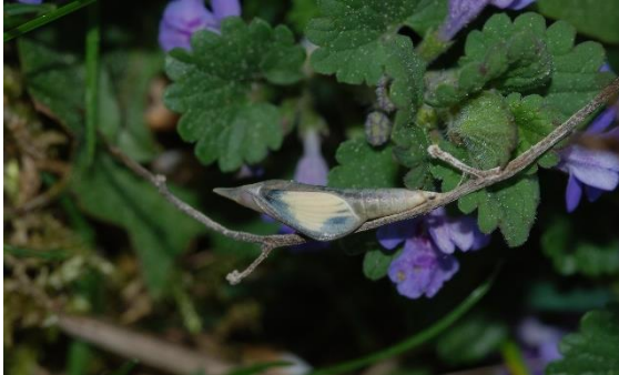
Abbildung 19: Puppe des Leguminosens-Weißlings nach der Überwinterung am 16.4.2009 (Zuchtfoto - ex ovo)

Schon kurze Zeit später ist der Falter geschlüpft.