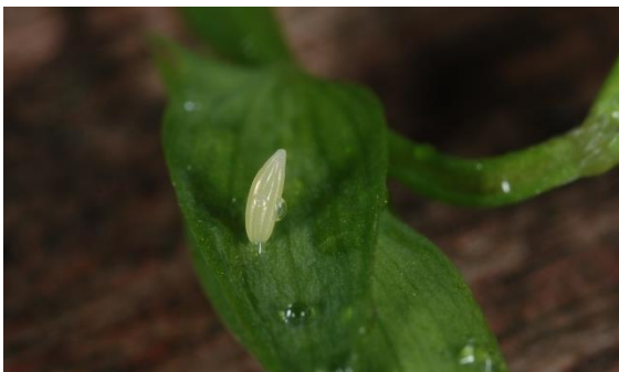
Abbildung 9: Frisch abgelegtes Ei des Leguminosen-Weißlings auf Vogelwicke am 23.7.2008 im Binger Wald bei Dichtelbach

Die Eier sind länglich, laufen konisch zusammen, sind aber oft leicht gebogen.