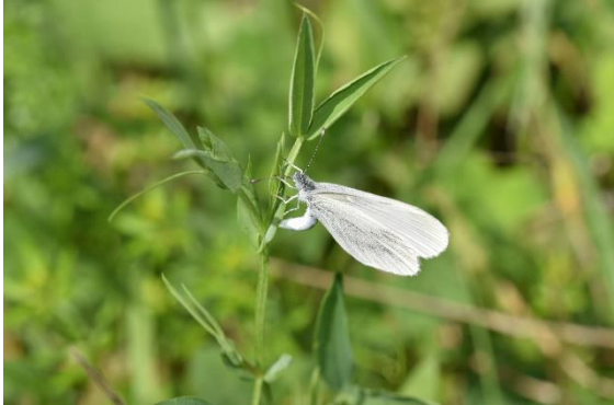
Abbildung 8: Eiablage des Leguminosen-Weißlings auf dem Rheindamm bei Ingelheim auf Vogelwicke am 9.8.2017

Rheindamm bei Ingelheim an Vogelwicke. Nach Literaturangaben kommen auch andere Leguminosen wie Hornklee oder Platterbsen als Eiablagepflanzen in Betracht. Die Eier wurden einzeln auf die schmalen Blätter abgelegt.