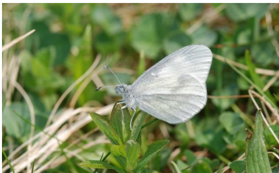
Abbildung 5: Leguminosen-Weißling auf einer Magerwiese im Binger Wald bei Dichtelbach am 13.4.2009

Die jahreszeitlich früheste Beobachtung gelang am 9.4.2009 in Bad Sobernheim und am 13.4.2009 im Binger Wald auf einer Magerwiese.