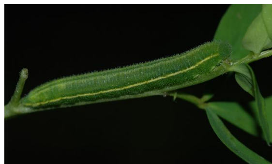
Abbildung 13: Erwachsene Raupe des Leguminosen-Weißlings auf Hornklee am 19.8.2008 in Bingen-Dromersheim (Zuchtfoto - ex ovo)

Schon bald nimmt die Raupe ihre grüne Farbe mit dunkelgrüner Rückenlinie und weiß-gelben Seitenlinien an.