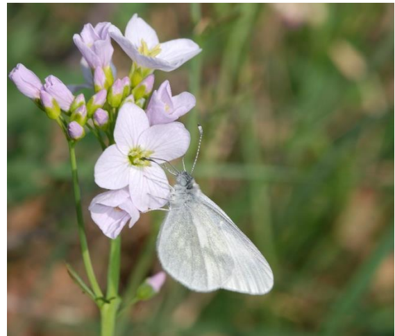
Abbildung 6: Leguminosen-Weißling bei der Nektaraufnahme an Wiesenschaumkraut im Binger Wald bei Dichtelbach am 14.4.2009

Die Falter setzen sich bei Bewölkung einfach auf erhöhte Pflanzen in der Vegetation. Sie saugen an Blüten unterschiedlicher Farben, wie z.B. Wiesenschaumkraut, Primeln, Bocksbart und sehr gerne an Vogelwicken und Platterbsen.