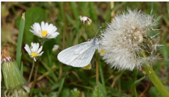
Abbildung 20: Frühjahrsfalter des Leguminosens-Weißlings an einer Pustelblume am 27.4.2014 im Freilichtmuseum in Bad Sobernheim, direkt neben dem Schmetterlingspfad.

Schon kurze Zeit später ist der Falter geschlüpft.