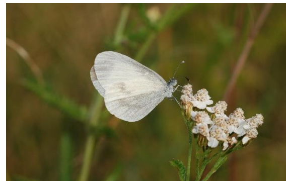
Abbildung 2: Männchen des Leguminosen-Weißlings im Binger Wald bei Dichtelbach am 31.7.2008 auf Schafgarbe – das grau der Spitzen der Vorderflügeloberseiten ist erkennbar.

Die selten zu sehende Flügeloberseite ist beim Weibchen einheitlich weiß, beim Männchen sind die äußeren Spitzen der Vorderflügel grau.