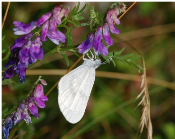
Abbildung 24: Leguminosen-Weißling saugend an Vogelwicke im Binger Wald nahe dem Jägerhaus am 22.7.2009

Der Leguminosen-Weißling leidet unter dem starken Eintrag von Stickstoff durch die Landwirtschaft. Im Garten wird man die Art selten antreffen. Jede Vermeidung von Stickstoffeintrag, von zu kurzen Mähintervallen, sowie zu frühen und koinzidenten Mähzeitpunkten hilft der Art. Dies gilt insbesondere für die Pflege von Bahndämmen und Deichen: kein Einsatz von Chemie (Glyphosat etc.), Mahd nur einmal im Jahr, Abtransport des Mähgutes (kein Mulchen!), Mähzeitpunkt ab Mitte Juli und immer nur Mosaikmahd, also höchstens 100 m am Stück, die nächsten 100 m sechs Wochen später usw.