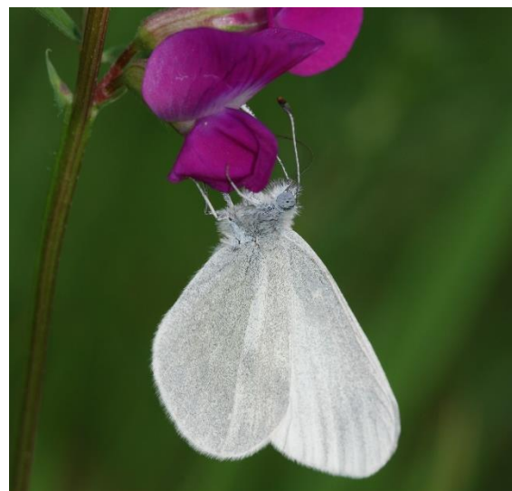
Abbildung 23: Leguminosens-Weißling saugend an Platterbse am 16.5.2008 im Binger Wald bei Dichtelbach

Der Leguminosens-Weißling ist für die Zucht in Umweltbildungsprojekten weniger geeignet. Die Eier oder Raupen der ersten Generation sind schwierig zu finden. Die Raupen der zweiten Generation entwickeln erst im nächsten Jahr zum Falter.