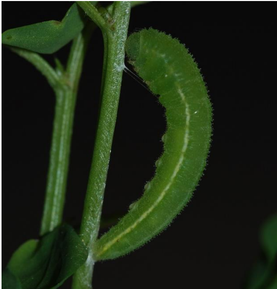
Abbildung 14: Vorpuppe des Leguminosen-Weißlings am 22.8.2008 an Hornklee (Zuchtfoto - ex ovo)

Zur Verpuppung sucht sich die Raupe einen geschützten Platz z.B. an der Fraßpflanze und spinnt sich mit dem Fußende unten an. Im Brustbereich spinnt sie einen Gürtel aus einer Vielzahl von Spinnfäden an die Unterlage. Zuletzt begibt sie sich in den Gürtel und es beginnt die Ruhephase der Vorpuppe.