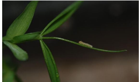
Abbildung 11: Frisch geschlüpfte Raupe des Leguminosen-Weißlings am 28.7.2008 auf Vogelwicke in Bingen-Dromersheim (Zuchtfoto ex ovo)

Die frisch geschlüpfte Raupe ist zunächst hell-transparent mit feinen langen Haaren bedeckt.